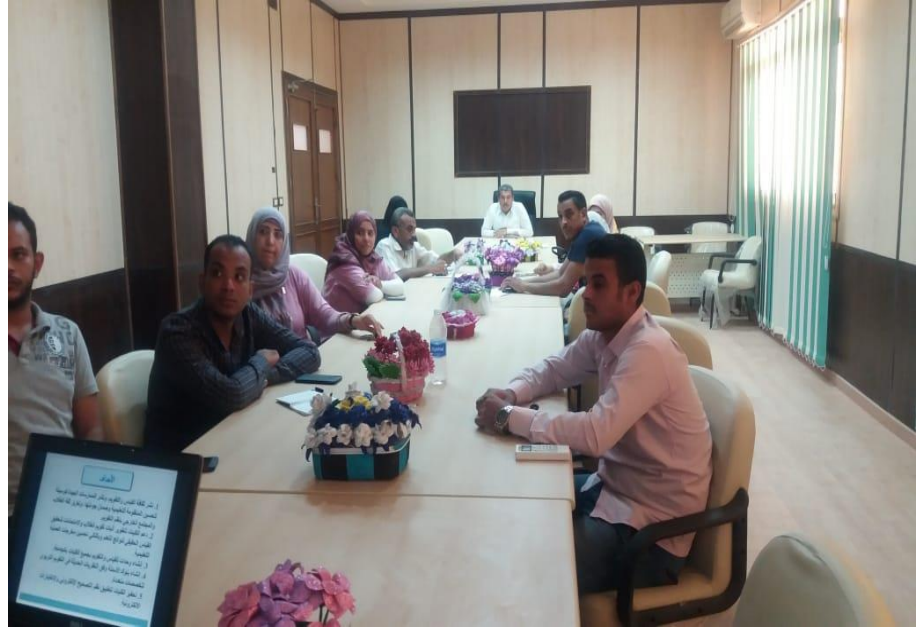
حضور ورش العمل بجامعة أسوان